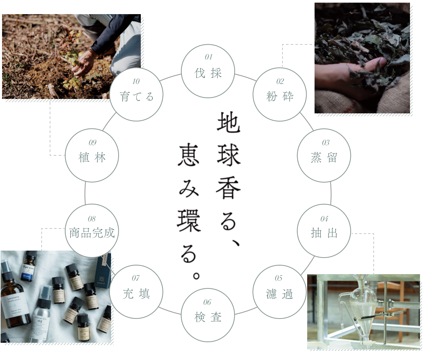
“HAKUSAN” Circular Distillation